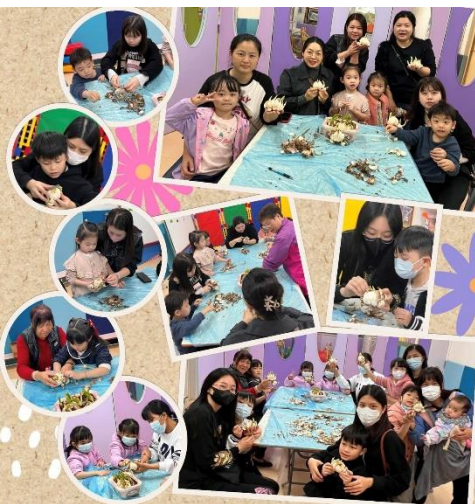
農曆新年剉水仙頭